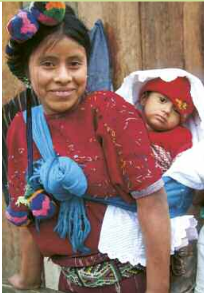
Qui e a pagina 21: reportage di viaggio in Guatemala e Messico, gennaio 2009