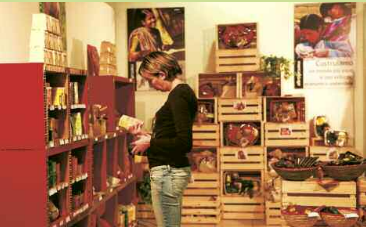
Stand Mandacarù alla Fiera Fiera Fa' la cosa giusta! Trento 23-25 ottobre 2009