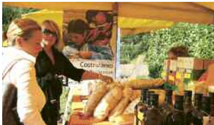
Stand a Naturalmente Bio! Rovereto

stand di prodotti biologici del commercio equo e solidale che dalla realizzazione di due