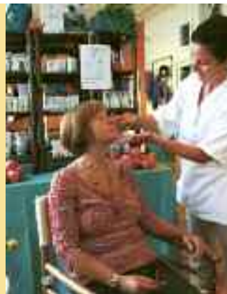
Settimana della cosmesi equo solidale da martedì 15 a sabato 19 settembre 2009 presso le Botteghe Mandacarù