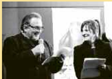
La premiazione

A pagina 11: degustazioni abbinata alle proiezioni presso il cinema Astra; a destra la rassegna a Predazzo